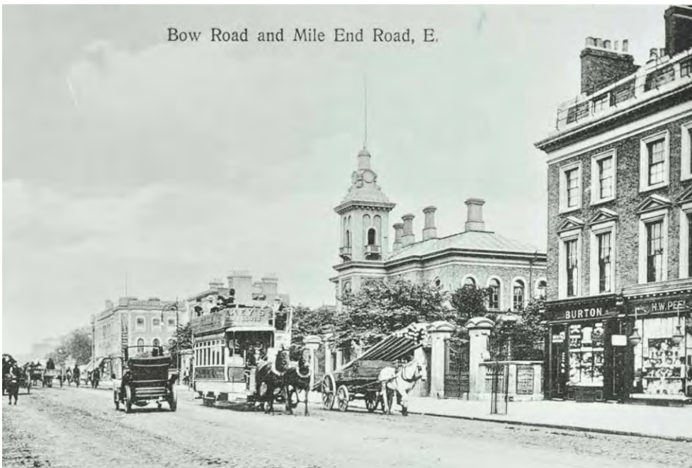
Бау Роад і Майл-Енд Роад, поч. XX ст.

1912 — комплекс знову відкрився як лікарня, керована Радою Лондонського графства (the London County Council). Заклад приймав понад 600 хронічно хворих людей (в сучасному розумінні його можна вважати лікарнею).