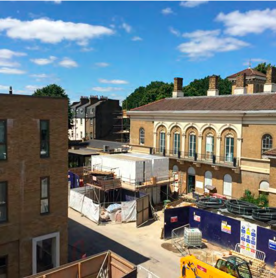
Будівля Джона Денгема на реконструкції.

2015 — CLT розпочав кампанію з метою перетворення будівлі Джона Денгема, що знаходиться на передньому плані Сент-Клементса та входить до списку культурних пам'яток, на громадський простір.