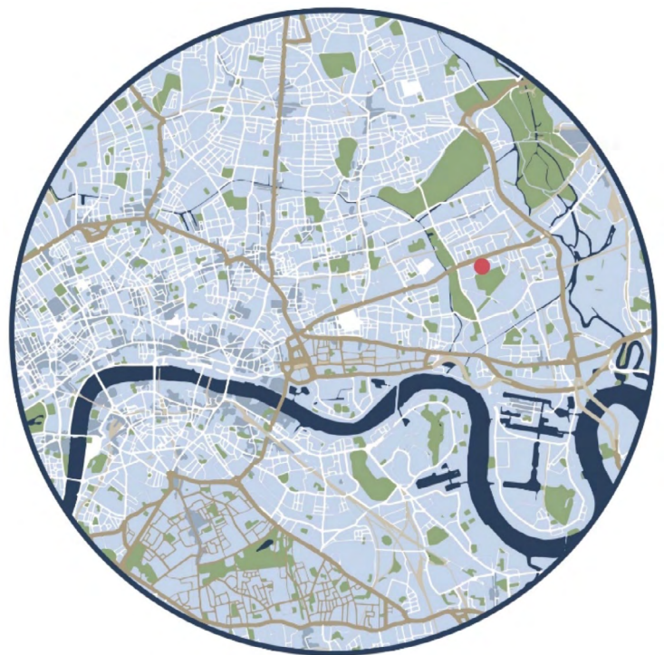
Сент-Клементс в Лондоні. Зображення Хорхе Москери (Jorge Mosquera)

Сент-Клементс розташований у східному Лондоні, за 5 км до Сіті — це дуже центральне розташування в рамках лондонської агломерації. Ця місцевість пройшла значні трансформації за останні десятиліття. Від початку будучи доволі скромним районом робітничих сімей, Сент-Клементс став місцем припливу населення у ХХ ст. За останнє десятиліття спекуляції з нерухомістю сягнули також східного Лондона, призвівши до зростання цін на житло та відтоку менш можливих мешканців. Джентрифікація та проблема доступності житла стали основою мотивації створення громадського земельного трасту у цій місцевості.