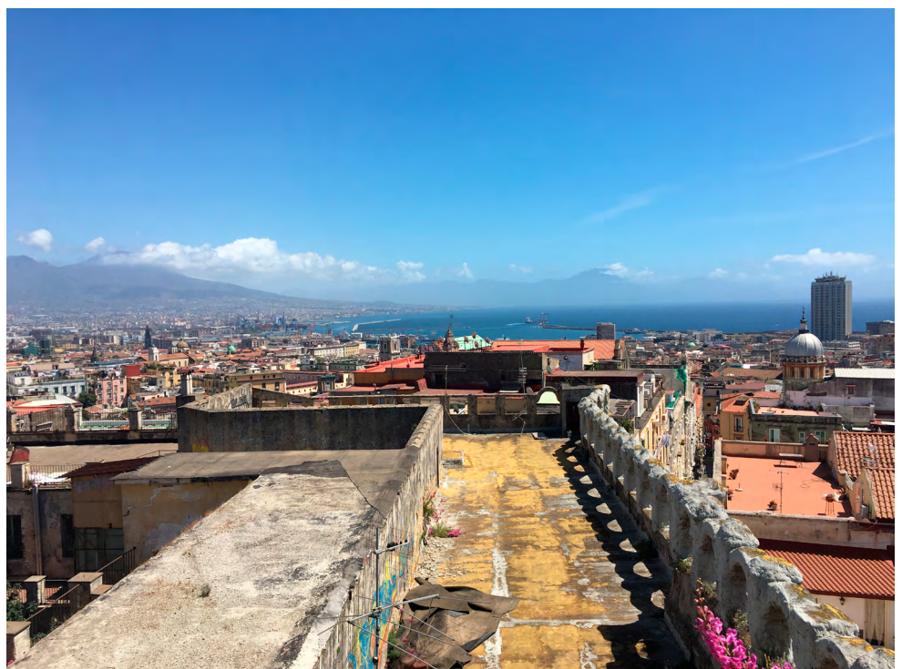
Вид на район і місто з даху комплексу. Фото: Левенте Поляк, 2018.

2014 — право власності на Капучіnelle було передано міській раді. Позаяк це частина центру міста, занесена у списки світової спадщини ЮНЕСКО, програма ЮНЕСКО надала пропозицію відновлення колишнього монастиря з метою його збереження через забезпечення належного утримання й публічного доступу. Окрім того, пропозиція також передбачає культурну мету для місцевості «Ізола Понтекорво» (Isola Pontecorvo) і частину місцевості Аввоката через реставрацію основних державних і приватних будівель, що націлено на створення «кварталу мистецтв» ( quartiere dell'arte ).