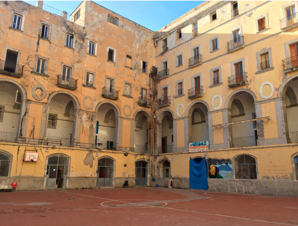
Всередині головного двору, 2018.

«Громадське користування» (uso civico) — це традиційний правовий інститут, що базується на старому праві колективного користування земними благами. Реінтерпретація цього «інструменту» в Неаполі переносить це старе право, що стосувалося пасовищ, полювання або рубки дерев на облишену нерухомість і в міський контекст. Спираючись на цю концепцію, низові організації у сквоті в публічній будівлі в історичному центрі Неаполя розробили нормативно-правовий акт, названий «Екс-Азіло Філанжері». Паралельно пара інших актів була затверджена міською радою Неаполя, ці акти визнавали сквоти, якщо вони служили потребам громади (культурні послуги, добробут, захист біженців, медичні послуги, надання житла). Місто оплачує загальні витрати, будівлями керують колективи, а власність лишається комунальною. Самоорганізація і самоврядування визначаються міськими нормативними актами як легальні форми організації. Це дозволило громадянам, і індивідуально, і як членам асоціацій, дбати про спільні інтереси, розбиваючи традиційну монополію державних структур у цій сфері.