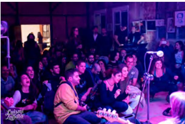
Подія в LaFábrica.

Сама LaFábrica detodalavida є некомерційною організацією. Вона є частиною міжнародної мережі «Коллективних архітектур». Організація також співпрацює з робочою групою Mainova Social Lab і центром підприємств та інновацій Centro Diego Diego Hidalgo. Ці організації працюють незалежно, хоча й мають однакові соціальні принципи, а останні дві фінансуються Fundaci6n Maimona (Фонд Маймони), який також має офіс на території заводу.