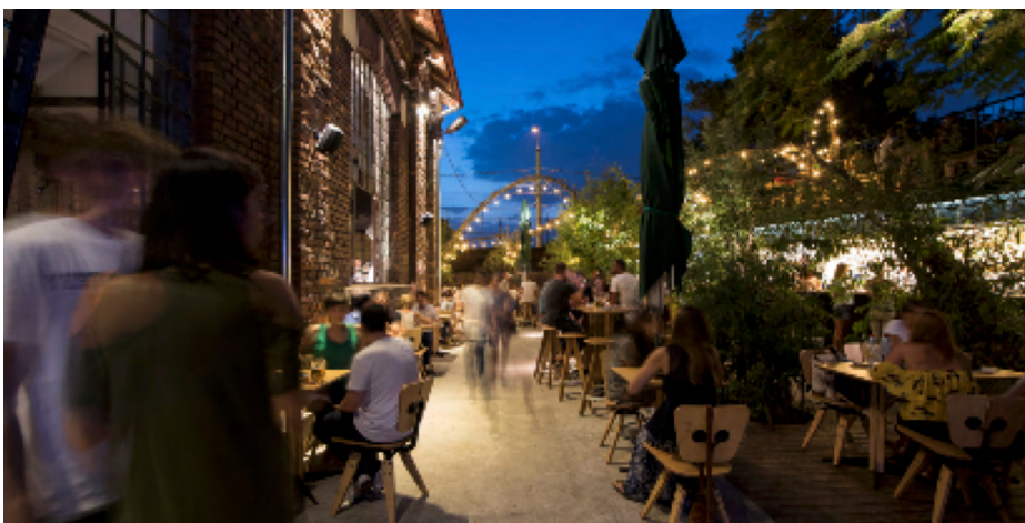
Тераса клубу «Експірат», розташованого в Цехах Кароля.

2016 — «Експірат», один із найстаріших клубів Бухареста, вирішив шукати більш безпечне місце і переїхав до Цехів Кароля. Попри те, що спочатку ініціатори мали більші плани щодо трансформації цехів Кароля, те, що їм вдалося переконати власника зберегти фабрику відкритою для культури, на відміну від більш комерційних варіантів, було перемогою.