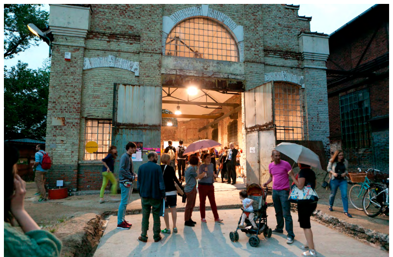
Румунський тиждень дизайну в Цехах Кароля, 2015 рік.

Гранти ЄЕЗ відкривають чудові можливості для фінансування проєктів, пов'язаних зі спадщиною, особливо в країнах Південно-Східної Європи. Окрім загальних правил ЄЕЗ, застосовуються додаткові правила місцевої програми. У випадку Румунії фондом керує Міністерство культури. Воно застосовувало дуже жорсткі процедури звітності, приділяючи особливу увагу не стільки змісту, скільки процесам й оформленню документів. Той факт, що головним заявником була приватна організація, ще більше ускладнив процес подання звітності.