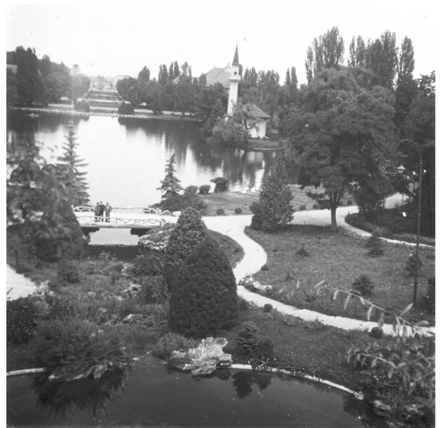
Парк Кароля, 1936 рік.

1906 — на пагорбі, що примикає до фабрики, створений парк Кароля — на честь 40-річчя правління короля Кароля та для розміщення Всесвітньої виставки 1906 року.