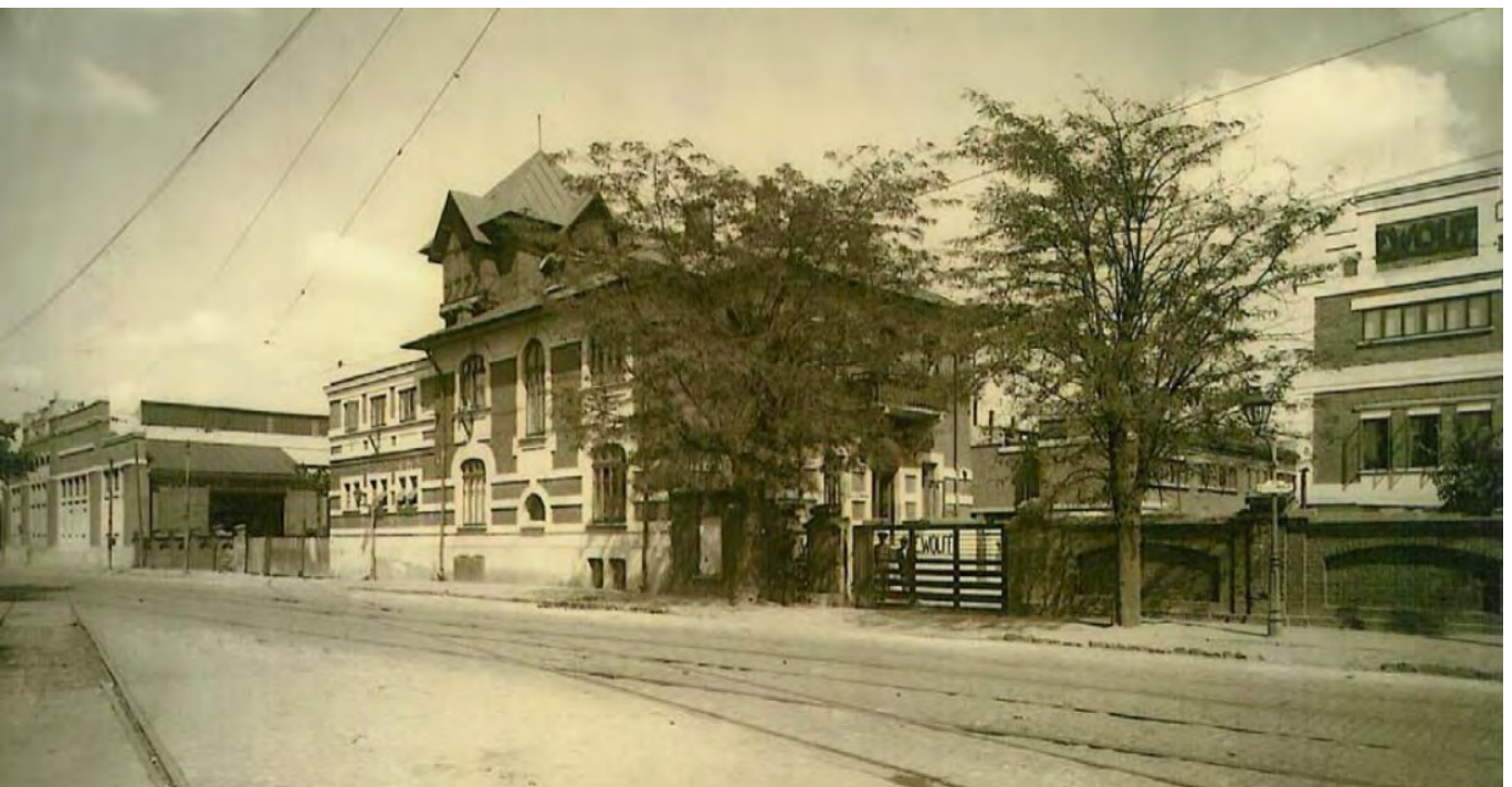
Зображення фабрики кінця XIX сторіччя.

Швейцарський інженер Ергардт Вольф, який був постачальником перев'язувальних матеріалів для російського штабу під час російсько-турецької війни, відкрив невелику майстерню в Генчеї 1877 року, а потім переніс її на теперішнє місце 1887-го. Він розширив бізнес завдяки імпорту машин для виготовлення боєприпасів, що надходили до армійського арсеналу, одночасно забезпечивши перші в країні потужності з постачання паротягів і задовольнивши попит місцевого ринку на обладнання. У зв'язку з розширенням нафтової промисловості завод опанував виробництво резервуарів, парових котлів, бурових установок, залізних конструкцій для мостів, чавунної та бронзової арматури. Деякі будівлі, побудовані в цей початковий період, усе ще стоять на південній стороні місцевості, поруч із церквою Філарета (1906–1910), а деякі будівлі виходять на парк Кароля (1905).