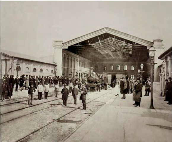
Бухарестський залізничний вокзал Філарет, 1875 рік.

що перетворили цю територію на найважливіші промислові квартали Бухареста.