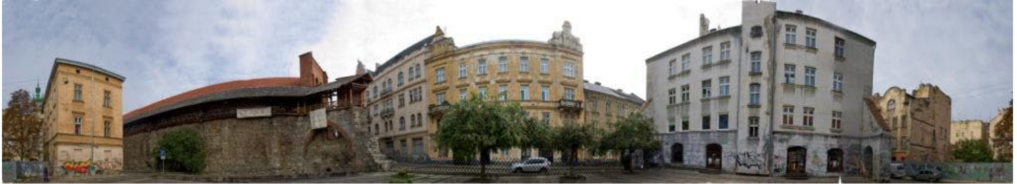
ПІДКОНКУРС "ПЛОЩА СИНАГОГ"

Міжнародний відкритий конкурс архітектурних, дизайнерських та ландшафтних проектів для впорядкування місць, пов'язаних з єврейською історією у м. Львові / Підконкурс "Площа синагог"